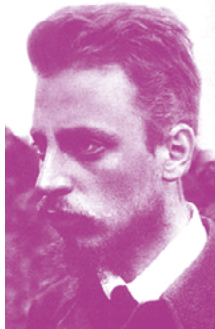
In foto Rainer Maria Rilke

Interventi musicali al violoncello di Ivan Leon. Il libro è corredato da citazioni di alcune lettere dello stesso autore e dall'elogio di Robert Musil, pronunciato dopo la morte di Rilke, che delinea un ritratto del poeta e gli restituisce l'importanza che merita riconoscendone la modernità.