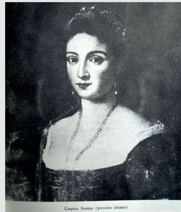
Gaspara Stampa (presunto ritratto)

Ente accreditato dal MIUR ai sensi della Direttiva ministeriale 90/2003; valido come corso d'aggiornamento del personale docente che può usufruire dell'esonero dal servizio nei limiti della normativa vigente (art. 64 CCNL del 29/11/2007)